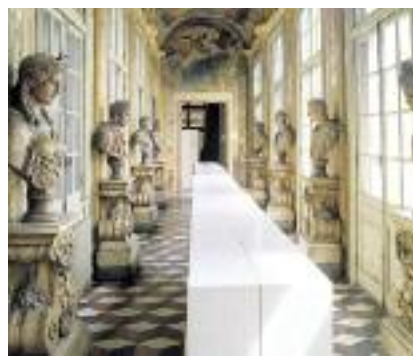
PALAZZO GIACOMO E PANTALEO BALBI (UNIVERSITÀ DEGLI STUDI DI GENOVA) VIA BALBI 4 sabato e domenica 10 - 19

Stefano Durazzo (1668 - 1744) Stefano Durazzo, doge dal 1734-1736, si rivolse al pittore Domenico Parodi per realizzare il trionfale ciclo di affreschi del palazzo in via del Campo, che lo vede rappresentato nelle vesti di un Nettuno "Ligustico", per celebrare il proprio ruolo di governatore della Repubblica.