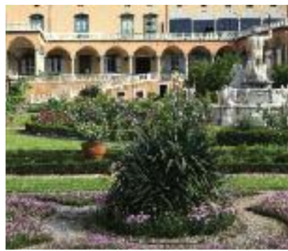
VILLA DEL PRINCIPE PIAZZA DEL PRINCIPE 4 sabato e domenica 10 - 18

Andrea Doria (1466 - 1560) Fatto erigere ed abitato da Andrea Doria, grande ammiraglio e protagonista della politica europea nella prima metà del XVI secolo, il Palazzo fu l'unica "reggia" che la Repubblica di Genova conobbe nel corso della sua storia secolare e ospitò molti dei personaggi più illustri presenti a Genova nel XVI e XVII secolo, a partire da Carlo V e Filippo II.