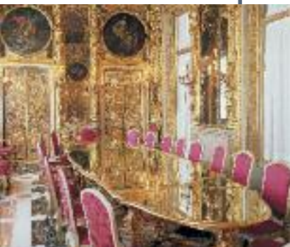
PALAZZO TOBIA PALLAVICINO VIA GARIBALDI 4 sabato e domenica 10 - 19

Antonio Doria (1495 - 1577) L'ammiraglio Antonio Doria, marchese di Santo Stefano d'Aveto e di Ginosa e parente più giovane di Andrea Doria, fu il primo proprietario di questo palazzo, costruito tra il 1541 e il 1543. La sua professione di armatore gli consentì di raggiungere una condizione di grande prestigio pubblico ponendosi al servizio prima della Marina Pontificia e poi dell'Imperatore.