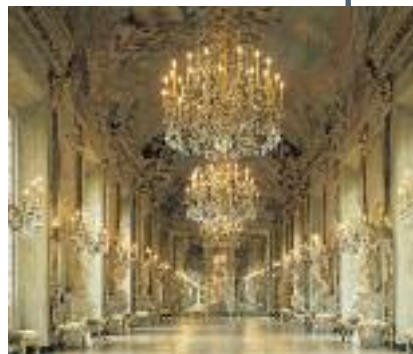
PALAZZO STEFANO BALBI (MUSEO DI PALAZZO REALE) VIA BALBI 10 sabato e domenica 9 - 19

Francesco Maria Balbi (1619 - 1704) Francesco Maria Balbi fu un capace imprenditore e allo stesso tempo munifico promotore delle arti. Chiamò così i giovani ed emergenti Valerio Castello, Domenico Piola e Gregorio De Ferrari a decorare con grandi affreschi il palazzo di via Balbi dove oggi si trova l'Università degli Studi di Genova.