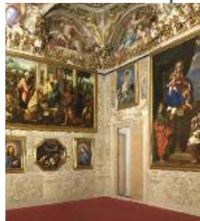
PALAZZO RIDOLFO MARIA E GIO FRANCESCO I BRIGNOLE SALE (MUSEI DI STRADA NUOVA - PALAZZO ROSSO) VIA GARIBALDI 18 sabato e domenica 10 - 19