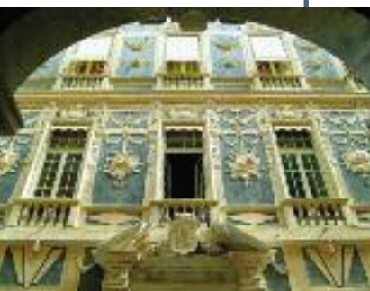
PALAZZO NICOLOSIO LOMELLINO VIA GARIBALDI 7 sabato e domenica 10 - 19

Tobia Pallavicino (? - 1581) Tra i più facoltosi aristocratici genovesi del XVI secolo, monopolista dell'importazione dell'allume di Tolfa, ricoprì importanti cariche pubbliche in città, dove fu senatore, e fuori della Repubblica. Colto e raffinato chiamò a progettare e decorare il suo palazzo Giovanni Battista Castello detto il Bergamasco che attraverso "Le storie di Apollo" celebrò Tobia e tutta la ricca e potente famiglia Pallavicino.