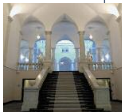
PALAZZO LUCA GRIMALDI (MUSEI DI STRADA NUOVA - PALAZZO BIANCO) VIA GARIBALDI 11 sabato e domenica 10 - 19