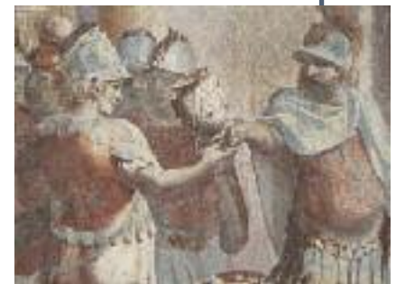
PALAZZO GIO VINCENZO IMPERIALE PIAZZA CAMPETTO 8A sabato e domenica 10 - 19

Ansaldo Pallavicino (1622 - 1660) Il palazzo costruito dai Grimaldi, e già inserito nell'elenco dei rolli nel 1599, nel 1650 diviene la dimora di Ansaldo, figlio del doge Agostino Pallavicino, che agli affreschi di Tavarone voluti dai Grimaldi accosta i dipinti del prediletto Grechetto accanto ai van Dyck, Carlone e Fiasella voluti dal padre.