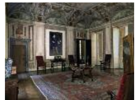
GALLERIA NAZIONALE DI PALAZZO SPINOLA PIAZZA PELLICERIA 1 sabato ore 8.30 - 19.30; domenica ore 13.30 - 19.30