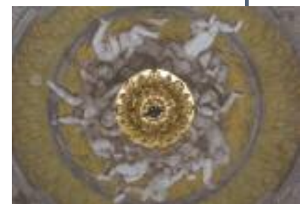
PALAZZO CESARE DURAZZO VIA DEL CAMPO 12 sabato e domenica 10 - 19

Gio. Vincenzo Imperiale (1582 - 1648) Gio. Vincenzo Imperiale fu uomo dai molteplici e straordinari interessi. Appassionato raccoglitore di statue antiche, bibliofilo e proprietario di una grande biblioteca, collezionista di dipinti e amico di Rubens e di molti altri artisti, fece del Palazzo di Campetto un manifesto culturale senza pari.