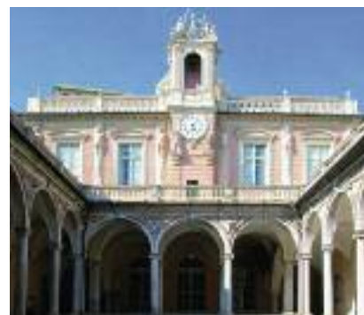
PALAZZO NICOLÒ GRIMALDI (MUSEI DI STRADA NUOVA - PALAZZO TURSÌ) VIA GARIBALDI 9 sabato e domenica 10 - 19

Luigi Centurione (1580 - test. 1653) Divenne proprietario del palazzo, a inizio Seicento, Luigi Centurione cui si deve la committenza dei rarissimi affreschi di Bernardo Strozzi dedicati ai temi della Fede e della navigazione, occasione per una originale raffigurazione degli indigeni d'America, i loro usi, gli animali e le piante delle nuove terre.